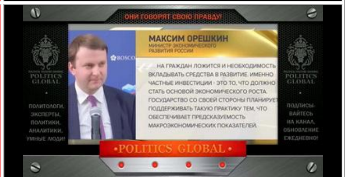
Орешкин М.С. - министр экономического развития РФ