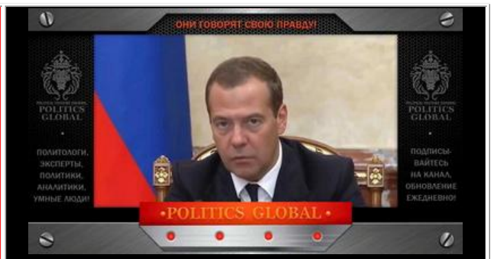
Медведев Д.А. - премьер-министр РФ