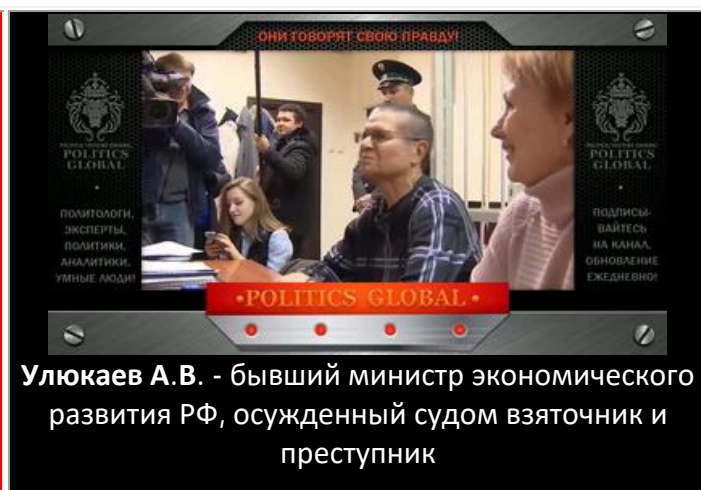
Улюкаев А.В. - бывший министр экономического развития РФ, осужденный судом взяточник и преступник

"Пятёрка экономических антигероев" №1 - Греф; №2 - Набиуллина; №3 - Силуанов; №4 - Кудрин; №5 - Орешкин.