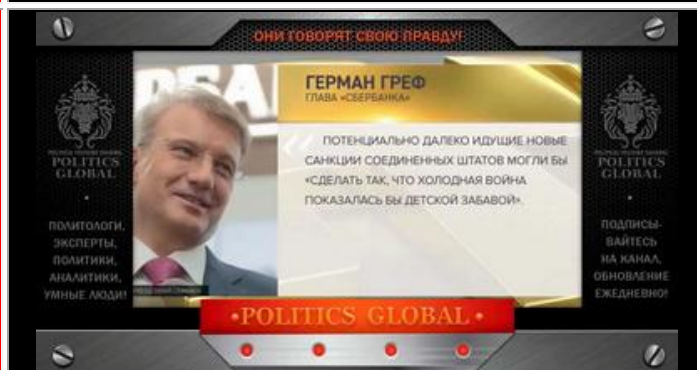
Греф Г.О. - глава "СБЕРБАНКА"