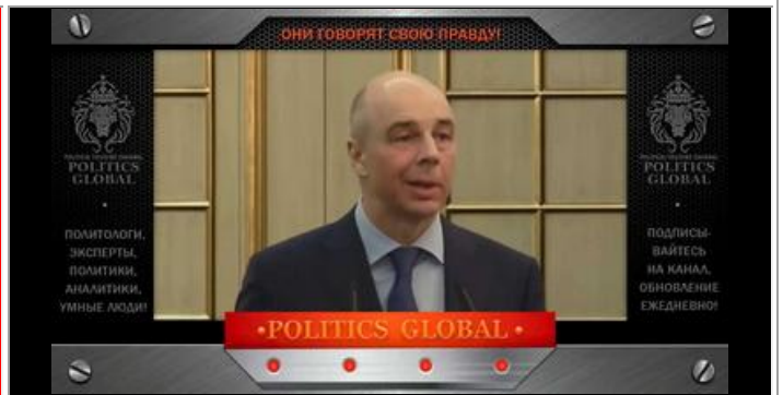
Силуанов А.Г. - министр финансов РФ