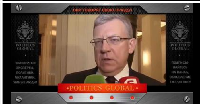
Кудрин А.Л. - бывший министр финансов РФ