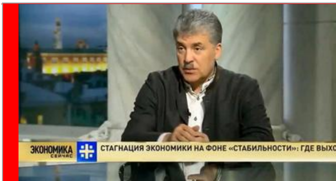
Грудинин П.Н. - Кандидат на пост президента России на выборах 2018, директор ЗАО «Совхоз имени Ленина»