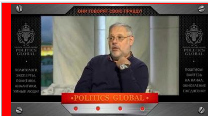
Хазин М.Л. - член Высшего совета Международного евразийского движения