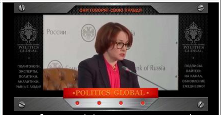
Набиуллина Э.С. - Председатель ЦБ РФ