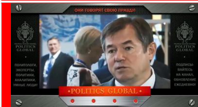
Глазьев С.Ю. - академик РАН, д.э.н., экономист, профессор, советник Президента РФ