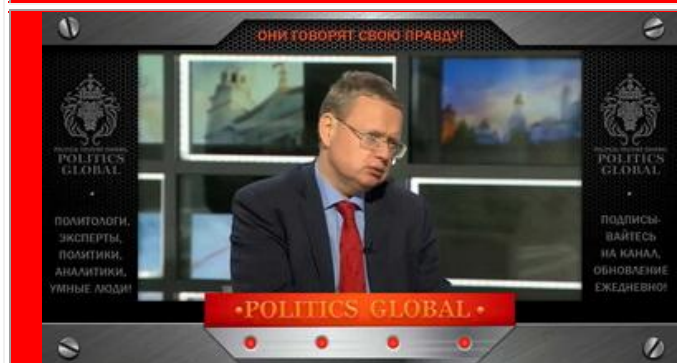
Делягин М.Г. - исполнительный директор АНО «Институт проблем глобализации»